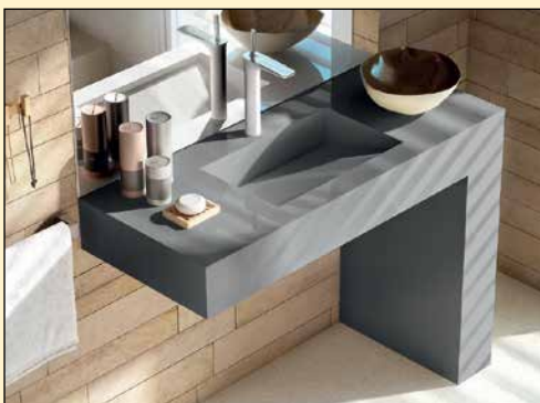
Silestone Balance 120 cm med designben høyre side.

6841 Skrei i Jølster • www.jolsterror.vvseksperter.no • E-post: trond@jolsterror.com