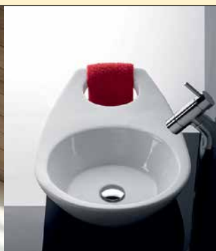
Saninusa Join montert på benkeplate.

AARDAL AS er lokalisert i Årdal Kommune mellom vakre Sognefjorden og mektige Jotunheimen. Selskapet ble etablert i 1987, med navnet Årdal Plast AS, og har over 25 års fartstid i bransjen. Dette gjør oss til en trygg leverandør med produkt tilpasset markedets utvikling.